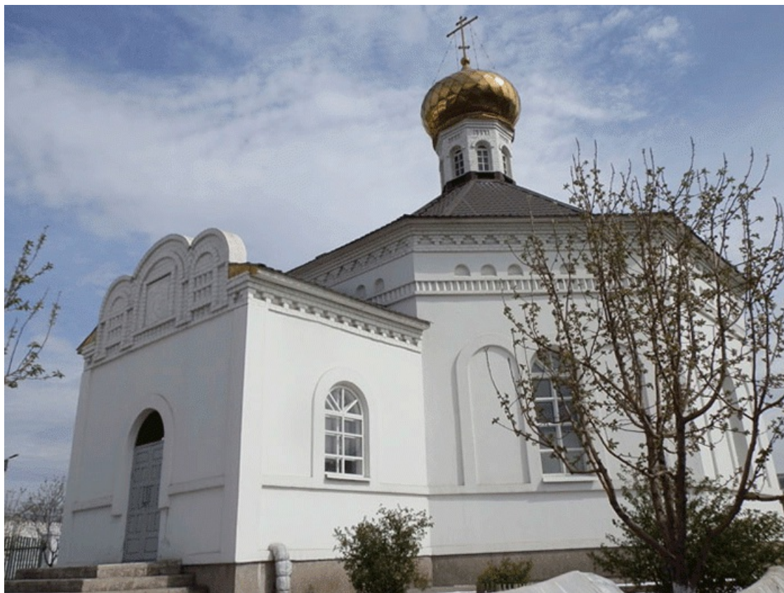
Фото 2. Воинский храм святого великомученика Георгия Победоносца г. Трехгорный-1, Челябинская область.

Фото 1. Храм святого равноапостольного князя Владимира на территории ИК—5, г. Новотроицк, Оренбургская область